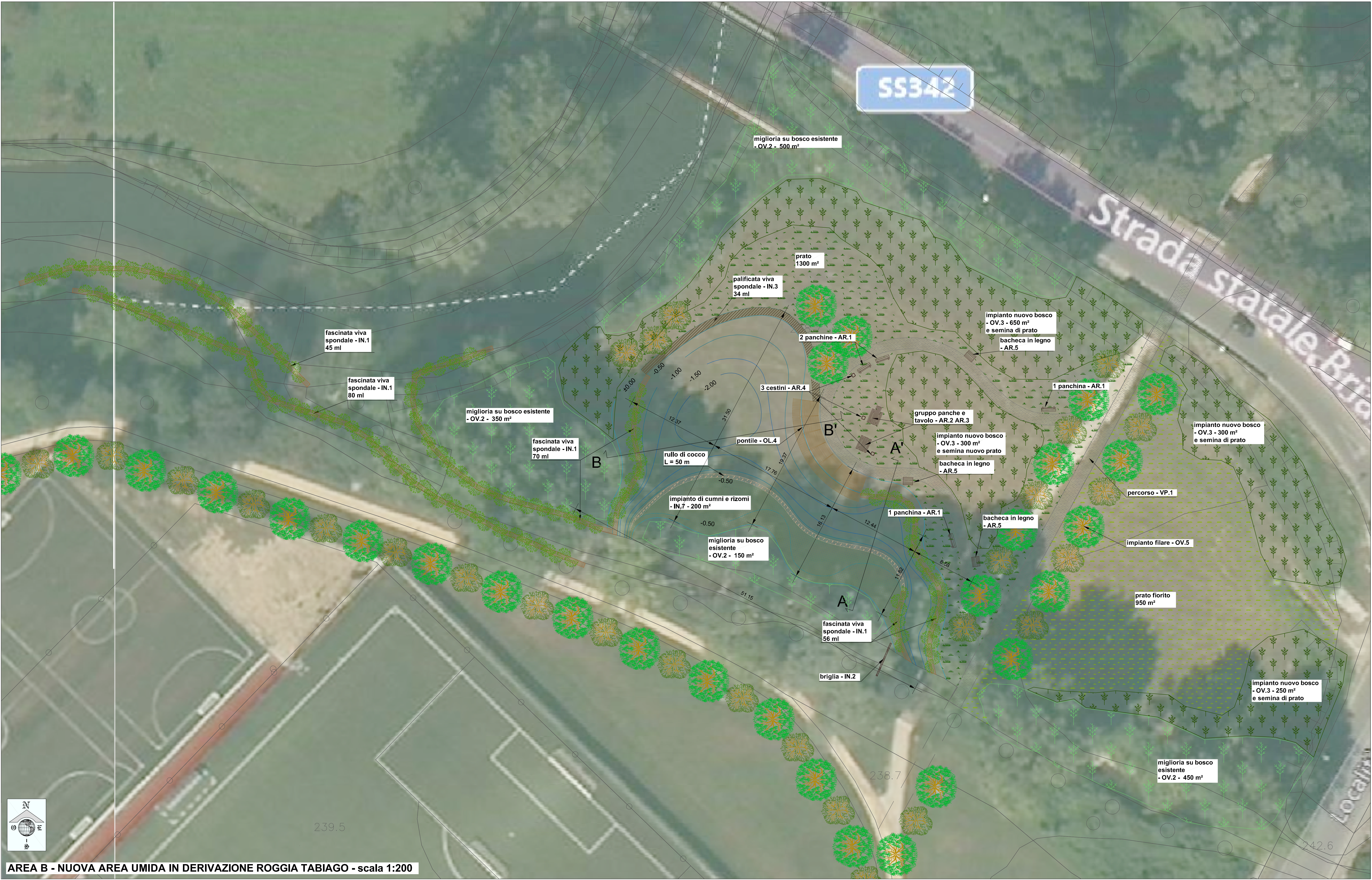
AREA B - NUOVA AREA UMIDA IN DERIVAZIONE ROGIA TABIAGO - scala 1:200